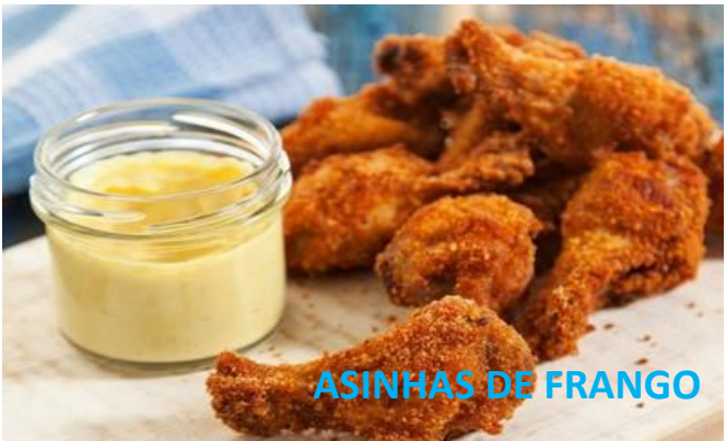
ASINHAS DE FRANGO